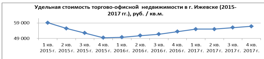
Рисунок 1. Динамика изменения стоимости торгово-офисной недвижимости в г. Ижевске

экономике», опубликованной в «Вестнике Удмуртского университета» 1