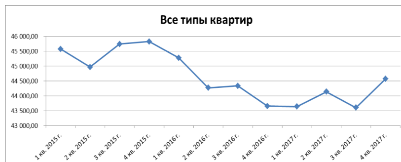
График динамики изменения средней стоимости квартир на вторичном рынке Удмуртии

Однако стоит отметить, что данные графики не учитывают скидки на торг и на долю земельного участка, приходящегося на ОКС. Помимо этого, стоит обратить внимание, что анализ динамики цен был проведен по сведениям, полученным на основании публичных предложений продажи объектов, без учета цен совершенных сделок. Оценщики считают неразумным сравнение цен сделок и предложений в одном ключе без применения скидки на торг. Стоит отметить, что данный анализ цен предложений (среднее значение удельного показателя рыночной стоимости) используется исключительно для отслеживания динамики изменения цен на некоммерческую недвижимость за период с 2015 по 2017 гг. и для последующей корректировки цен на дату. Оценщики считают справедливым отслеживание ценовых изменений на рынке недвижимости в разрезе цен предложений, т.к. объем заключенных сделок из квартала в квартал в течение года может существенно варьироваться и отследить процент «фиктивных» сделок представляется практически невозможным.